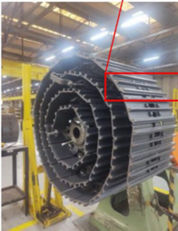
Esteira (de tração)